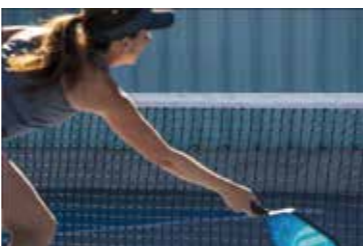
ウィンブルドンコート