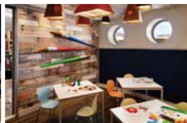
ウェイブス・ファンタジア (キッズクラブ)