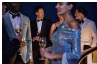
ジェイド・ナイトクラブ

クリスタルは、バラエティに富み、ハイセンスなエンターテイメントプログラムと充実のひとときをお届けします。お好きな場所で、お好きな時間をお過ごしください。