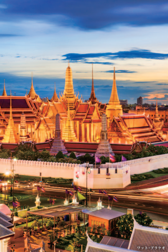
ワット・フラクオ