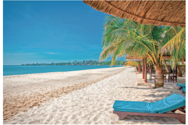
ソカビーチ(シアヌークビル)