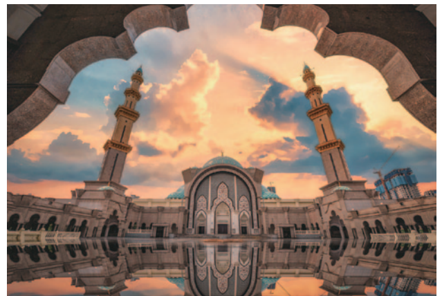
連邦直轄鎮モスク(ポートケラン)