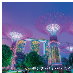
ガーデンズ・バイ・ザ・ベイ

ペナンでは、東南アジアでよく目にするカラフルで華やかな布「バティック」の専門店でお好みのバティックを見つけてください。