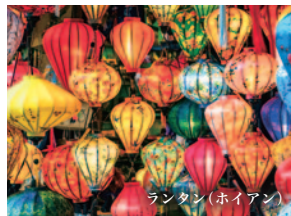
ランタン(ホイアン)

基隆からバスで約1時間の人気の観光地、九份。懐かしさを感じるレトロな建物と幻想的な風景をゆっくり歩きながら楽しみましょう。