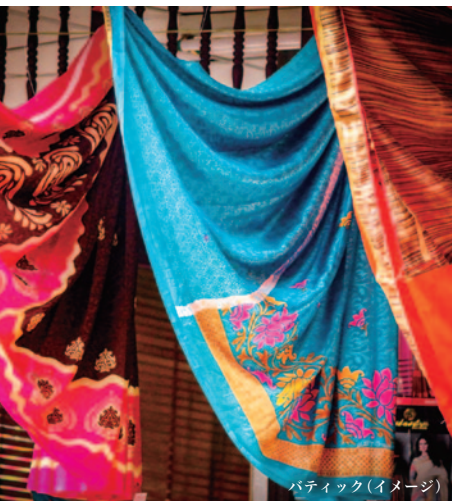
バティック(イメージ)

幻想的なランタンで有名なホイアンや古都フエなど、ダナンを起点に魅力的な観光スポットへ足を延ばしてみましょう。