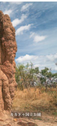
カカドゥ国立公園

コモド国立公園内しか生息していない、古代の姿のまま生きている貴重なコモドオオカゲに出会えます。