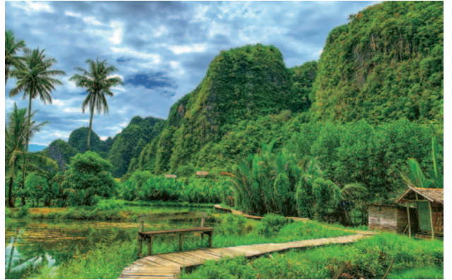
ラマンラマン(マカッサル)