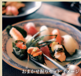
おまかせ握りセット イメージ

※ご予約は船上で承ります。詳しくは船上でご案内いたします。※寿司はご提供のない日もございます。