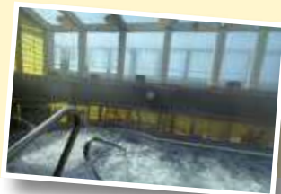
スパ(有料)でゆったりくつろぎタイム