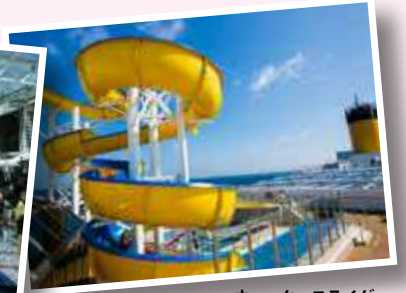
ウォータースライダー