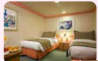
2名1室利用イメージ