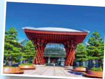
アクセス抜群の金沢駅 (乗下船日は有料シャトルバス運行)