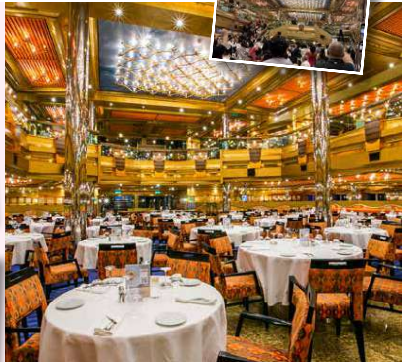
メインダイニング アラカルトのコース料理となります。