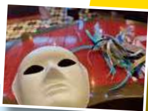
仮面制作して夜の仮面パーティーへ