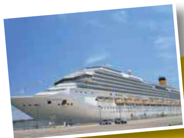
大迫力のコストアセレーナ

コンセプトは「海の上のイタリア」。コストクルーズはイタリア生まれのクルーズ船。同室3-4名様目の 12歳未満のお子様2名まで無料 など、家族旅行にもおすすめ。料金も格安で気軽でカジュアルです。また金沢発着コストクルーズ史上最大客船のコスタセレーナで、非日常の洋上体験と発見の旅をお楽しみください。