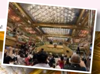
レストランクルーによるショーも!