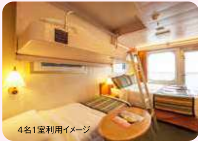
4名1室利用イメージ