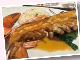
メインレストランメニューの一例