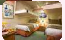
4名1室利用イメージ