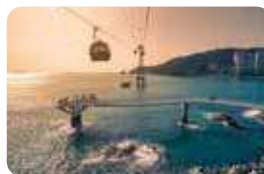
松島海上ケーブルカー

海に面した美しい「海東龍宮寺」、韓国最大の海鮮市場「チャガルチ市場」の王道スポットの他に、韓国のマチュピチュと言われるカラフルな「甘川文化村」で街散策や、「松島海上ケーブルカー」で上空散歩を楽しんだり、車窓に大海原が広がる観光列車が走る「海雲台ブルーライン」も人気です。