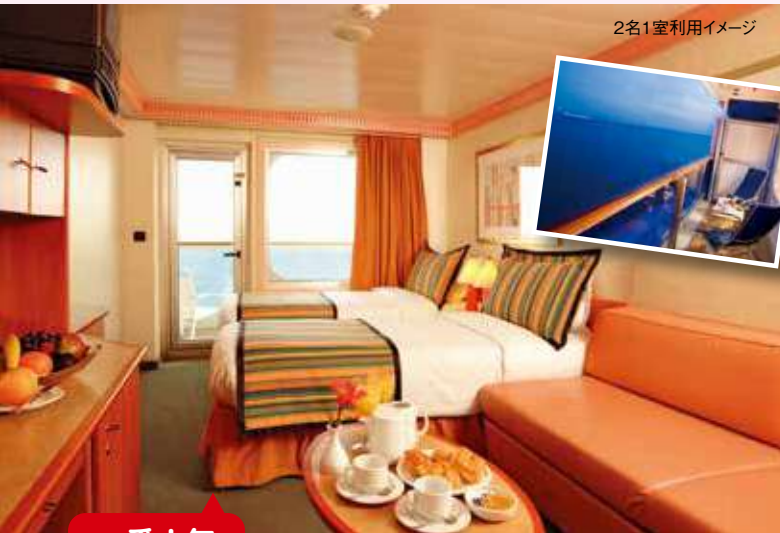
2名1室利用イメージ