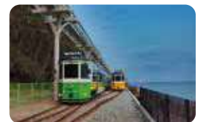
海雲台ブルーライン

【行程】港出発 ▶▶▶ 甘川文化村 ▶▶▶ 龍頭山公園 ▶▶▶ 釜山タワー ▶▶▶ 港到着