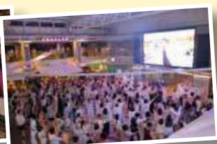
夜はホワイトパーティーへ