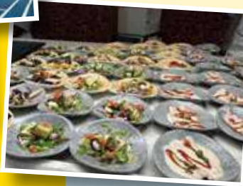
目移りするビュッフェメニュー