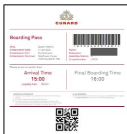
ボーディングパスイメージ

完了後、ボーディングパスをダウンロードし、ご乗船当日にご持参ください。（プリントアウトまたはデータ）