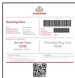
ボーディングパスイメージ

完了後、ボーディングパスをダウンロードし、ご乗船当日にご持参ください。（プリントアウトまたはデータ）